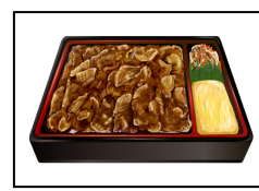
イベリコ豚重弁当