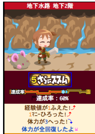
捕まえた後は一緒にダン ジョンを冒険できます