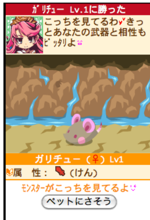
モンスターを捕まえる チャンス到来

プレイヤーとメンバは、ダンジョンを進みモンスターを倒すことで経験値を得て、レベルが上がるごとに「HP」、「攻撃力」、「防御力」等のパラメータが上昇し成長していきます。