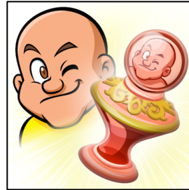
第1回放送の限定アイテム 「16連射きあいチャージ」