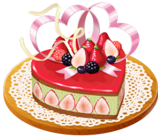
「ぼくのレストラン2」期間限定レシピ