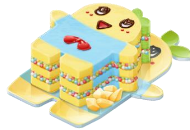
ふなっしーのアイスクーキ シャーベット添え (コラボアイテム一部紹介)