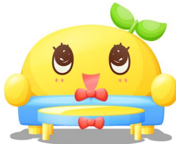
ふなっしーのソファセット