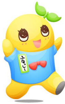
ふなっしーボディ ふなっしーフェイス