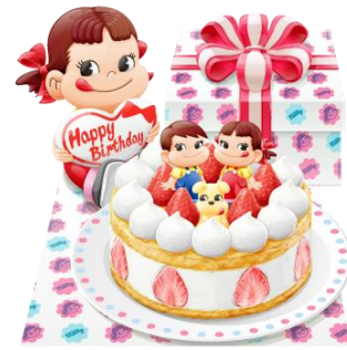
ペコちゃんポコちゃんバースデーケーキ