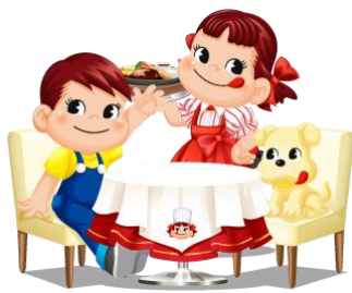
不二家レストランへようこそ