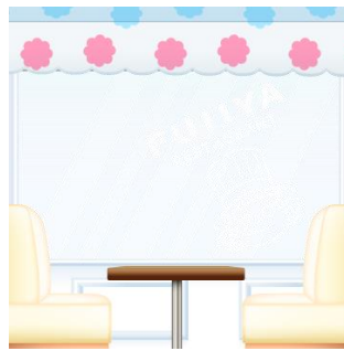
ミルクールーフのウィンドウシート