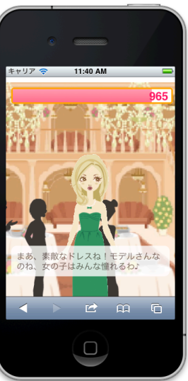
<パーティーシーン>