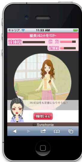
<撮影シーン>カメラアングルを演出