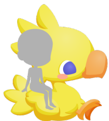
チョコットおすわりチョコボ