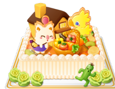
チョコボ農園の採れたてベジケーキ