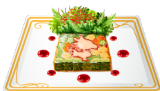
復刻チョコボ農園の新鮮野菜のテリーヌ