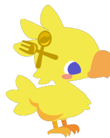
ぼくレスカチューシャ(ゴールド)