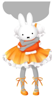
ミッフィーといっしょ♪