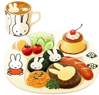
ミッフィーお子様ランチ

Illustrations Dick Bruna © copyright Mercis bv,1953-2015 www.miffy.com (コラボアイテム一部紹介)