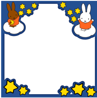
ミッフィーとメラニーの なかよしフレーム